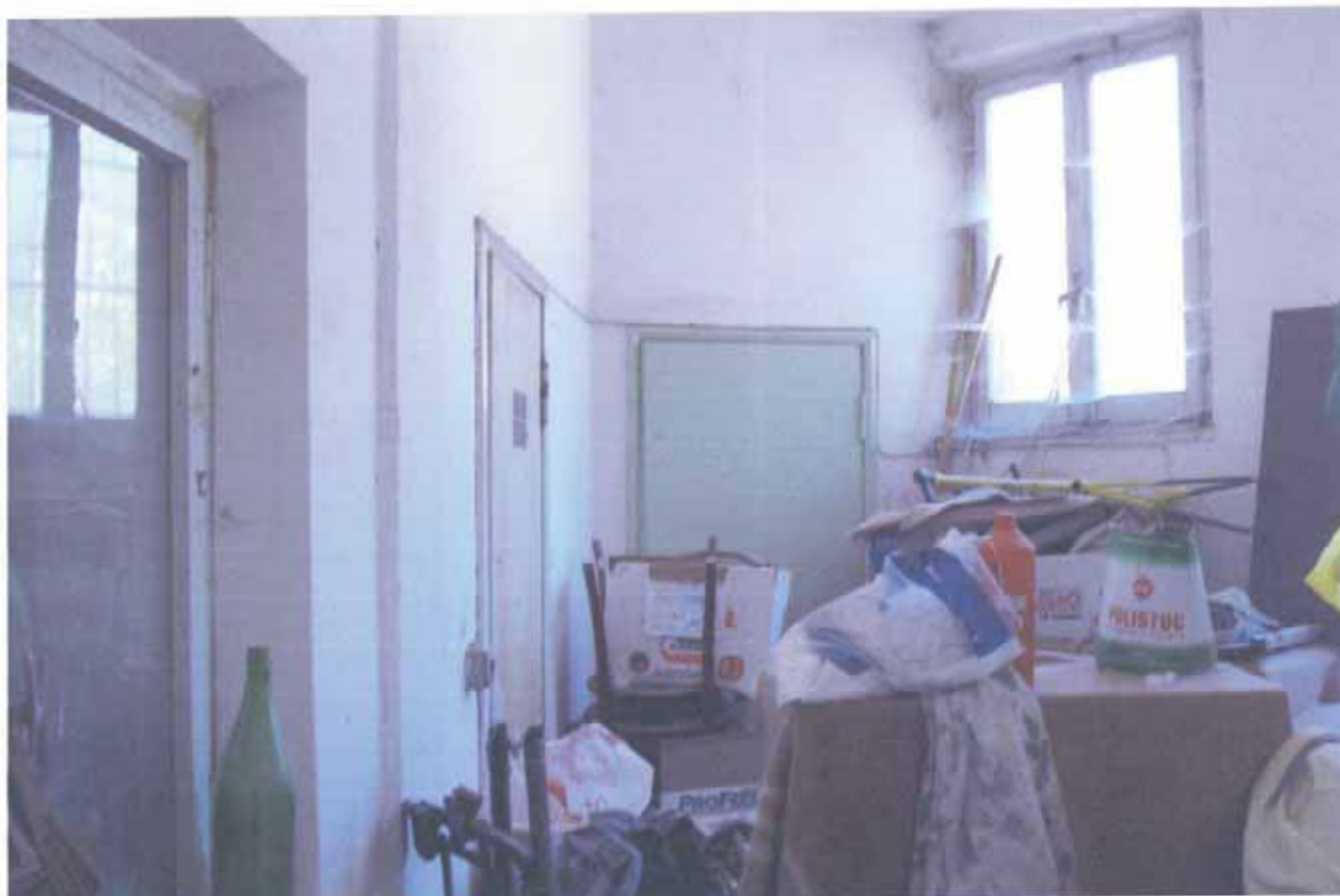
FOTO N.5 = INTERNO DELL'UFFICIO CON PORTA D'INGRESSO DEL RIPOSTIGLIO.