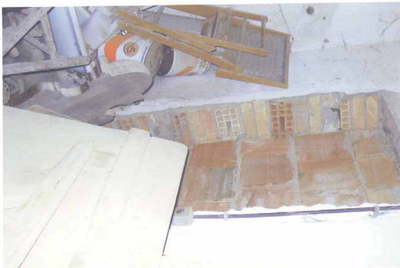
FOTO N.15 = INTERNO SPOGLIATOIO PORTA TAMPONATA NELLA PARETE SUD.