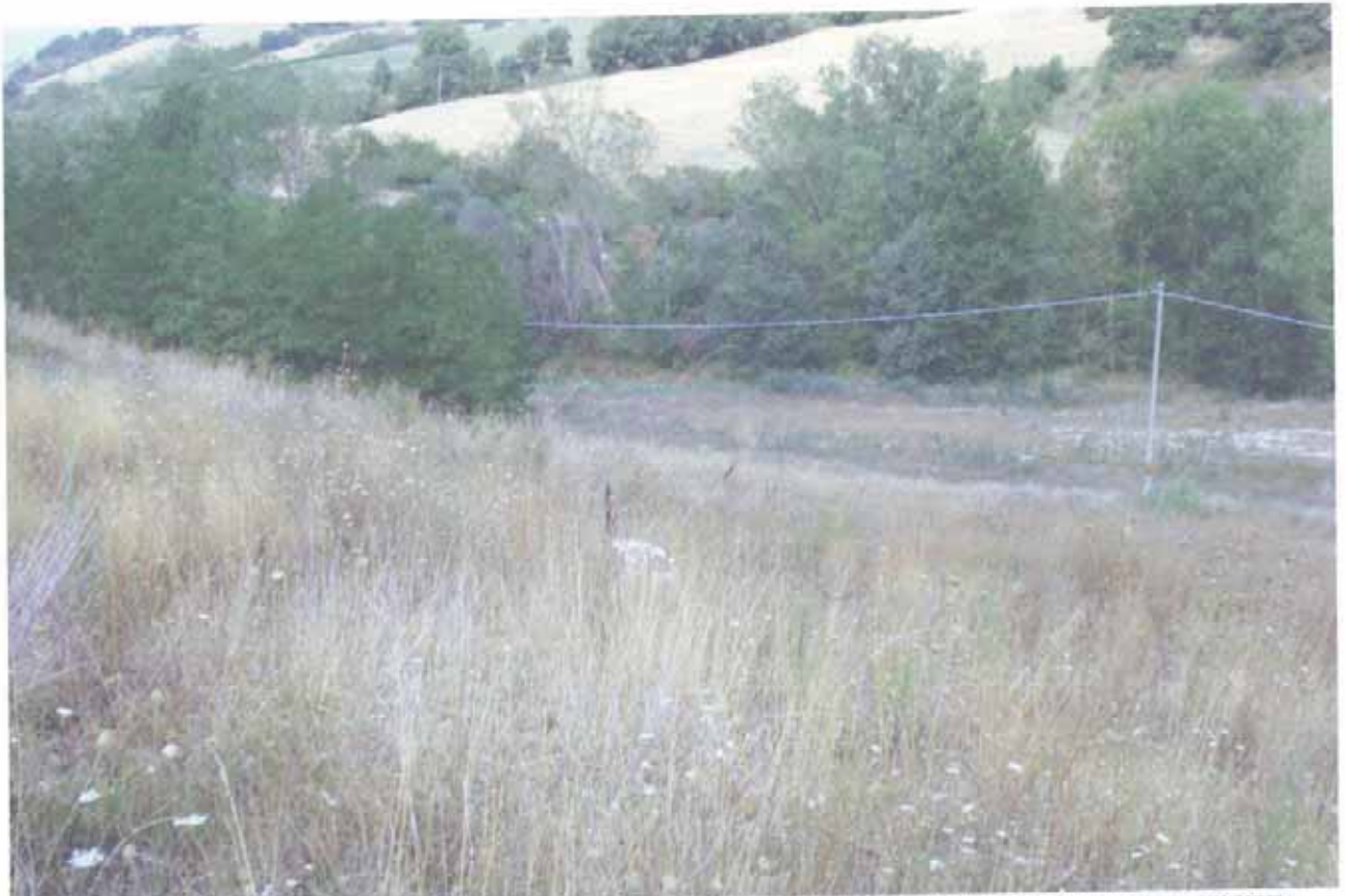
FOTO N.43 = PARTICELLE N.83 E N.87 CON VISTA DA MONTE VERSO IL TORRENTE.