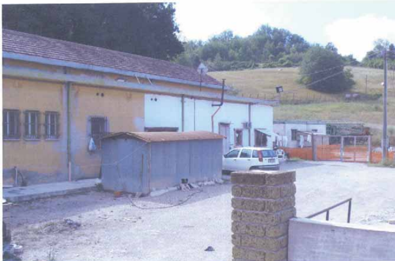
FOTO N.31 = INGRESSO ESTERNO AL DEPOSITO MATERIALI EDILI VISTA SUD.