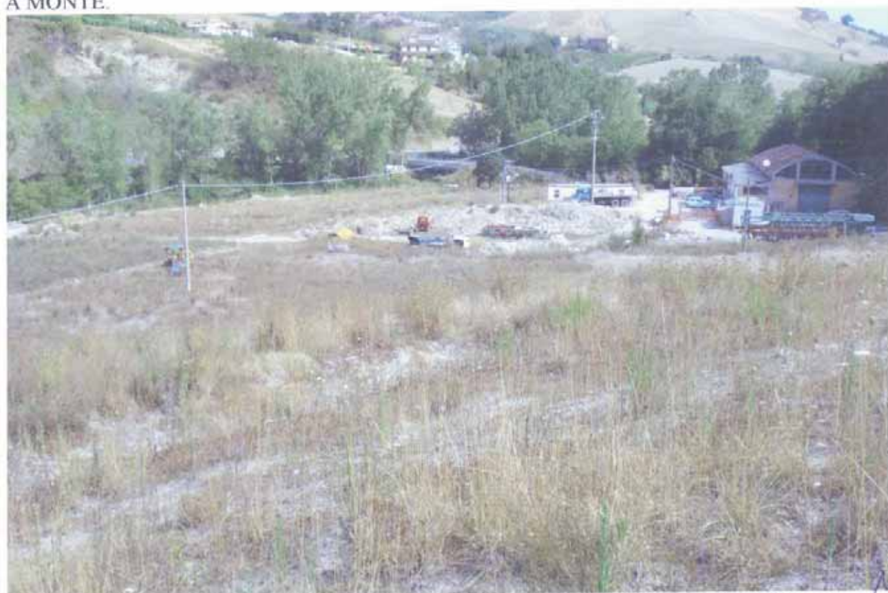
FOTO N.42 = PARTICELLE N.28 E N.81 CON VISTA VERSO OVEST DAL CONFINE A MONTE.