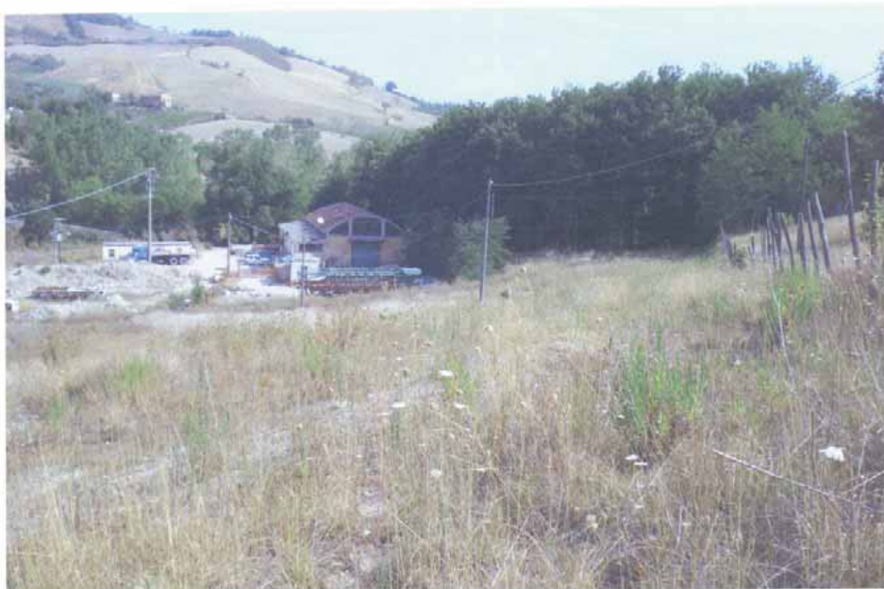
FOTO N.41 = PARTICELLE N.28 E N.81 CON VISTA VERSO NORD E LUNGO IL CONFINE A MONTE.