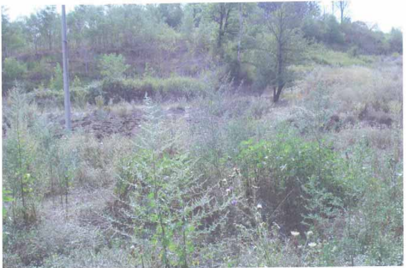
FOTO N.47 = PARTICELLE N.87, N.84 E N.85 VISTE IN PROSSIMITA' DEL TORRENTE E VERSO MONTE.