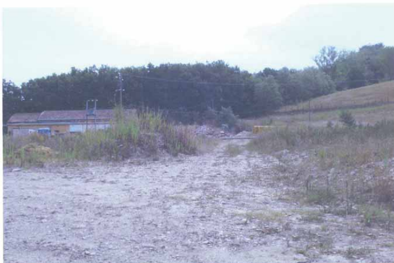
FOTO N.37 = PARTICELLE N.28 E N.81 ALL'INIZIO IN CORRISPONDENZA DELLA STRADA VICINALE IN PROSSIMITA' DEL TORRENTE E VISTA VERSO EST (A MONTE).