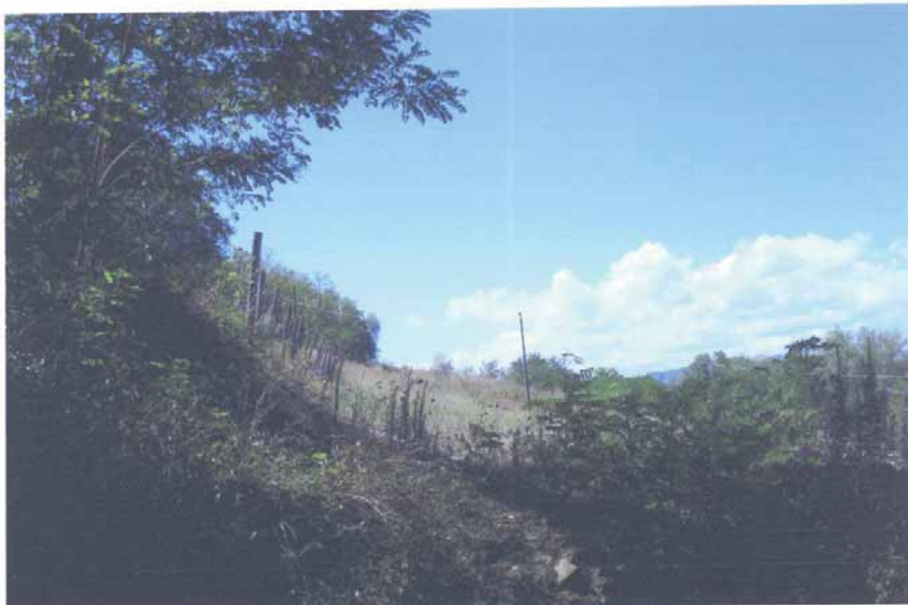
FOTO N.39 = PARTICELLA N.81 VISTA DALLA STRADA VICINALE E VERSO SUD.