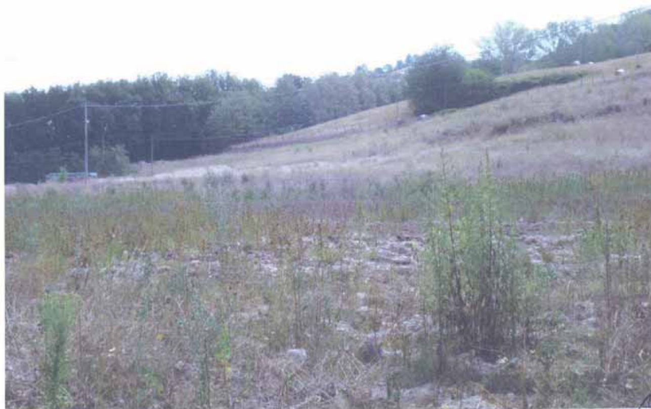
FOTO N.38 = PARTICELLE N.28 E N.81 IN PROSSIMITA' DEL TORRENTE E VISTA VERSO EST (A MONTE).