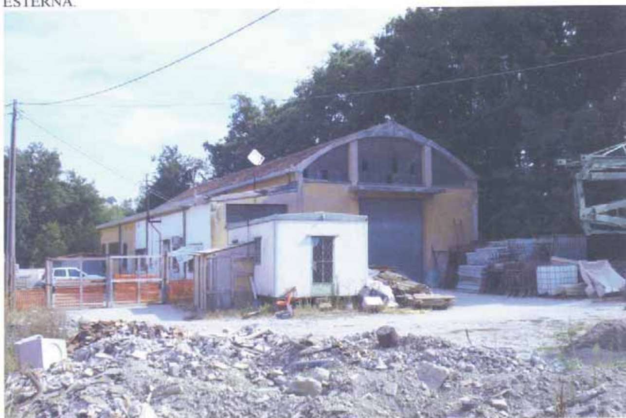
FOTO N.36 = ANGOLO SUD-OVEST DEL DEPOSITO MATERIALI EDILI CON CORTE ESTERNA.