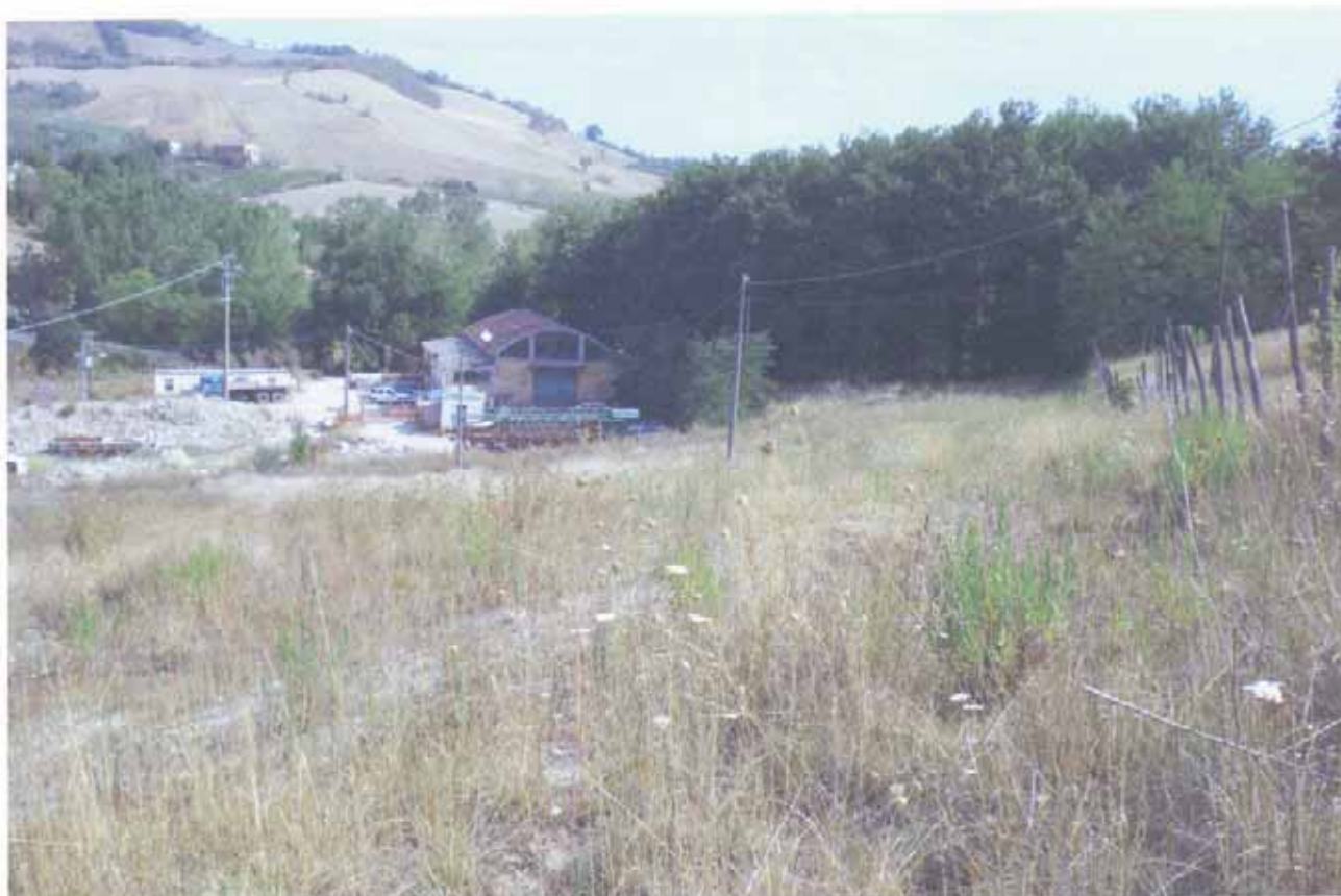
FOTO N.35 = PROSPETTO SUD DEL DEPOSITO MATERIALI EDILI CON CORTE ESTERNA.